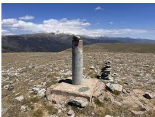
Cim de la Creueta