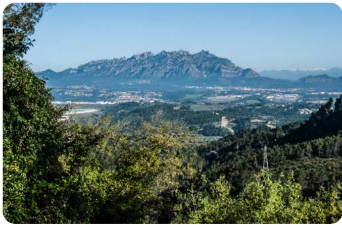
Panoràmica des de la Serra de l'Aragall

La Serra de l'Aragall està situada entre els municipis de Castellví de Rosanes i Corbera de Llobregat, en la comarca del Baix Llobregat. La nostra caminada circular tindrà lloc dintre del terme municipal de Castellví de Rosanes, el qual limita també amb el de Gelida (Alt Penedès) al bell mig de la unitat geològica de les Serres d'Ordal, les quals estan dins la protecció PEIN (Pla d'Espais d'Interès Natural). En el nostre recorregut podrem gaudir d'esplèndids i extensos boscos, mitjançant camins ombrívols i corriols careners amb vistes espectaculars, si el dia ho permet. En el preciós bosc de titularitat municipal s'hi troba el denominat balcó de Montserrat, ubicat en una alterosa cinglera, és un mirador natural des d'on es pot contemplar una dilatada panoràmica.