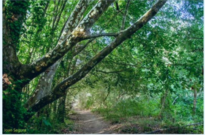
Boscós de l'entorn

Continuarem el nostre itinerari fins a un altre popular talaia, la Cadira Miravinya del turó de la Malgranada, mirador força concorregut donada la seva originalitat. Seguirem la nostra volta circular, vers la carena del Puig Cúgol, on per un boscós, enlairat i planer camí arribarem a la Creu de terme de Lavit, on també es pot gaudir d'una amplíssima vista del municipi de Torrelavit. Des d'aquest punt, baixarem fins a arribar de nou al punt d'inici, havent realitzat un recorregut molt variat i amb forces punts d'interès.