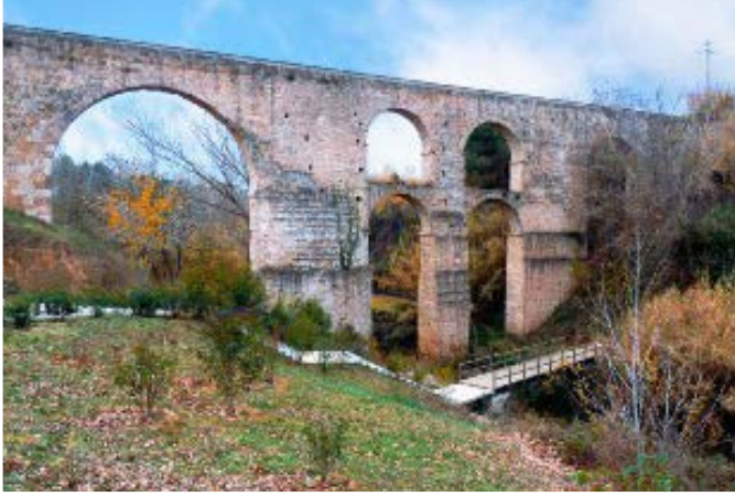
El Pont Nou (Sant Pere de Riudebitlles)

El Pont Nou és un aqüeducte d'origen medieval. En el passat, l'aigua que portava movia les rodes hidràuliques dels deu molins paperers que hi havia