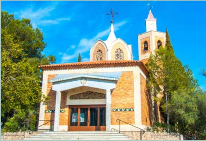
Iglesia de la Mare de Déu de Montserrat (Clariana)

El terme municipal de Castellet i la Gornal, amb una extensió de 47,5 quilòmetres quadrats, limita amb onze municipis més de l'Alt i Baix Penedès i del Garraf.