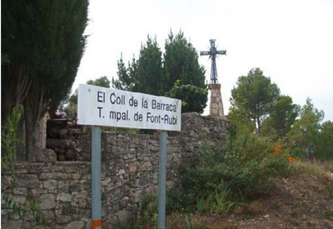
Coll de la Barraca

El Coll de la Barraca està situat a 700 metres d'altitud, en plena serra de Font-rubí. Es tracta d'un grup de cases ben arranjades, confluència dels municipis de Font-rubí, Torrelles de Foix i