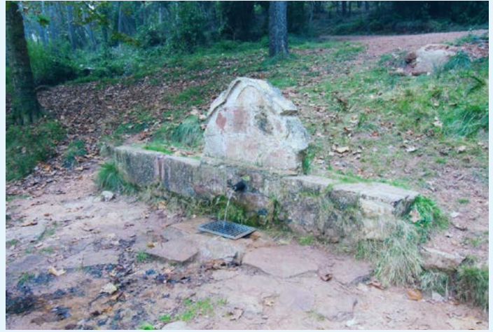
Font de Llinars

ha sigut molt preuada per la seva aigua, però ara molt afectada per la greu sequera que pateix bona part de Catalunya.