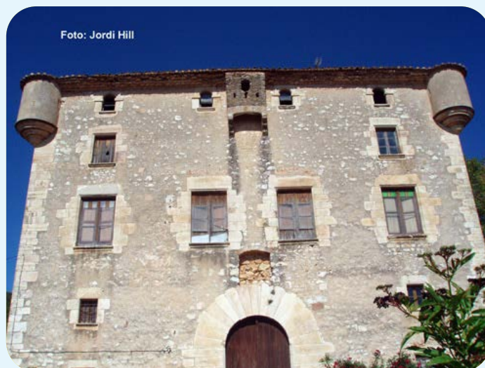
Mas de Pontons

En baixar del cim podrem visitar El Poblat ibèric del Castellar, es tracta de les restes d'un recinte fortificat on s'han practicat diferents treballs d'excavació per part dels arqueòlegs amb la troballa de diferents estris de ceràmica, elements de decoració personal, armes i eines, així com també una petita podadora per la verema. La recerca d'aquest fortí cal emmarcar-la en l'ibèric final (segles II-I aC) on la fi del sistema ibèric està lligada a la incorporació d'aquest territori al domini romà.