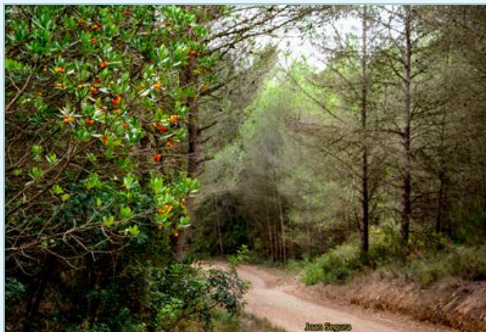
Bosc de l'entorn

La nostra caminada descriurà una volta circular en sentit horari, passant per forces zones boscoses que alternen camins més amplis amb estrets i frondosos corriols.