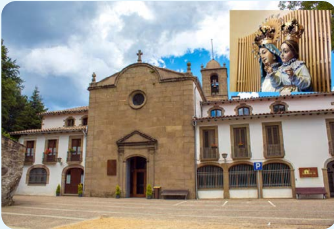
Santuari de la Salut

L'Espai Natural Protegit de Collsacabra, enllaça el Prepirineu oriental amb la Serra Prelitoral, dins el context de la Serralada Transversal. En el seu interior s'hi troben grans masses forestals de caràcter atlàntic, com són els boscos de faig, intercalades amb conreus i prats associats a l'activitat ramadera. Un verdader paradís per a nosaltres, amants de la natura i el senderisme.