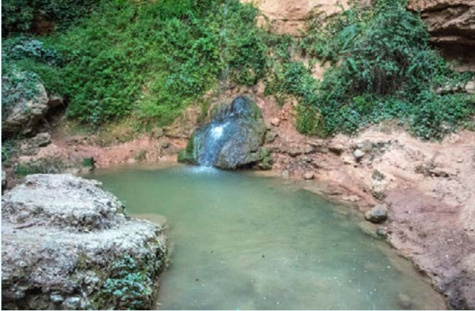
Salt de la Mala Dona

En el municipi de Cabrera d'Anoia es troba un indret de rellevant importància ecològica: El Paratge de Canaletes, dintre de l'Espai Natural Protegit de les Valls de l'Anoia. Es tracta d'un