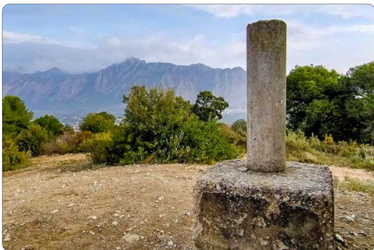
Turó de Can Dolcet

El Turó de Can Dolcet de 416 metres es troba en el punt culminant d'una orografia que rep el nom d'una masia ben prospera anomenada Can Dolcet. Aquest cim és punt d'unió dels municipis d'Hostalets de Pierola i Collbató, damunt del